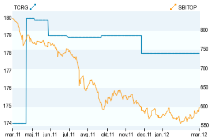
Graf 1: Pregled gibanja tečaja delnice TCRG v obdobju marec 2011 do marec 2012

Družba ali katerakoli tretja družba za račun družbe v poslovnem letu ni sprejela v zastavo lastnih delnic in jih tudi na dan 31.03.2012 nima v zastavi.